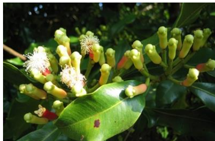
ต้นไม้ประจำวิทยาลัย กานพลู

สีขาว หมายถึง การตั้งมั่นอยู่ในความดี ความบริสุทธิ์ ตามหลักศาสนา